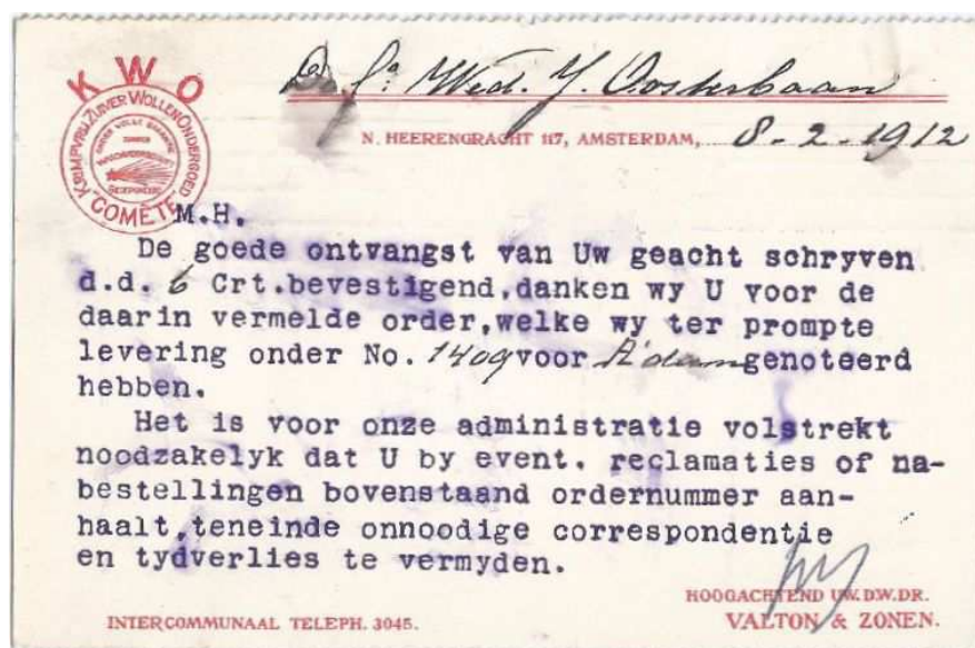
Afb. 1 Briefkaart met perfin MK 1 uit 1912

Enige tijd geleden stuurde Nolco Oosterhagen, die me deze briefkaart had voorgelegd, scans toe van een andere briefkaart met de perfin MK 1.