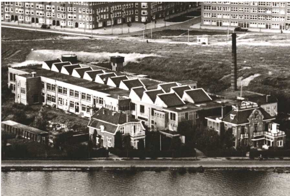
Afb. 4 Nederlandsche Tricotfabriek v/h Valton & Zonen aan de Amsteldijk.

Die plannen uit 1911 worden uiteindelijk in 1915 gerealiseerd. Aan de Amsteldijk wordt dan een nieuwe fabriek met directeurswoning in gebruik genomen. De naam is inmiddels veranderd in Nederlandsche Tricotfabriek v/h Valton & Zonen. Er werken dan ca. 300 arbeiders. Zie afbeelding 4.