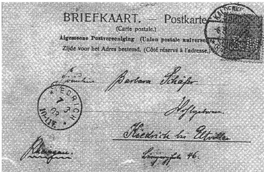
Afb. 3 Achterzijde prentbriefkaart.

De eerste jaren tot het begin van de twintigste eeuw was het uitsluitend een Duits missiehuis. Met de bouw van het huidige klooster is in 1881 begonnen en voltooid in 1912. Hier stichtte hij in totaal drie congregaties, gericht op de missie. De resterende 34 jaren van zijn leven bracht hij door in dit klooster van Steyl en stierf op 15 januari 1909. Op 5 oktober 2003 is hij door paus Johannes Paulus heilig verklaard.