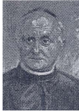
HEILIGE ARNOLD JANSSEN 1837 - 1909