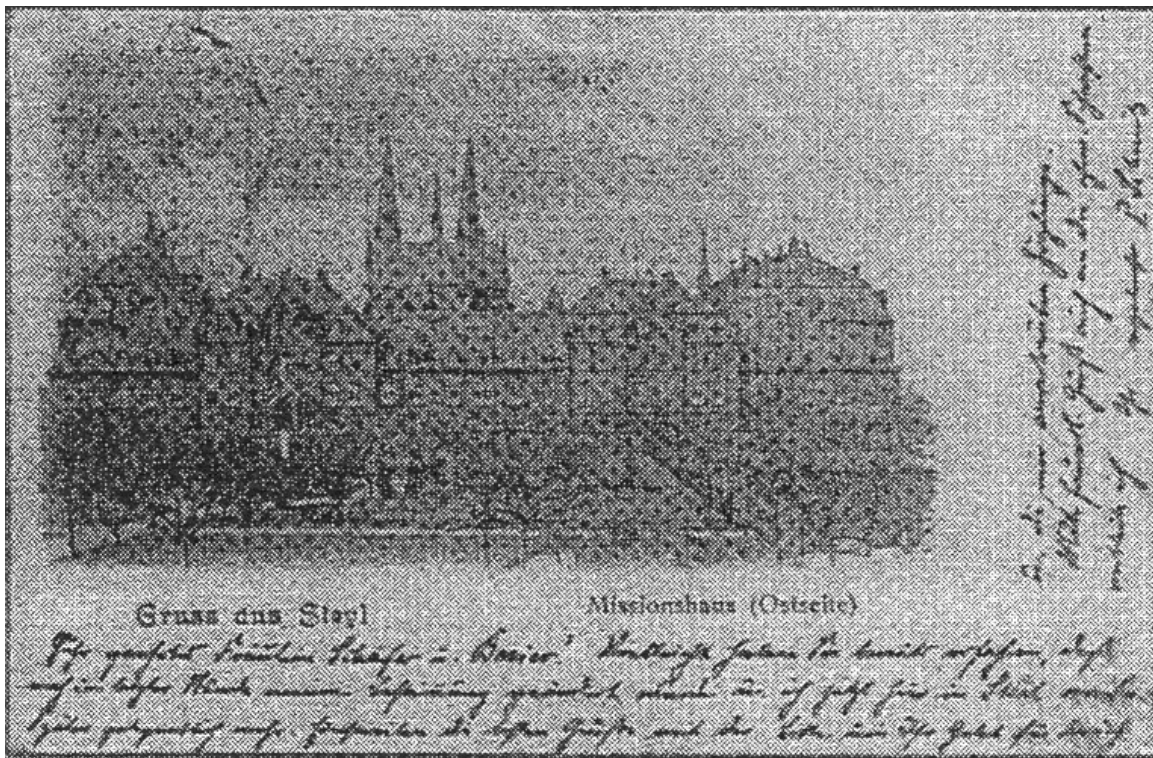
Afb. 1 Voorkant van de kaart.

Al meer dan honderd jaar zijn er ontelbare prentbriefkaarten, ook ansichtkaart genoemd, verstuurd aan vrienden, bekenden en familieleden. Meestal gebeurde dit om de thuisblijvers een kiekje te bezorgen van hun vakantieverblijf of om een kort berichtje te sturen. De eerste kaarten verschenen aan het einde van de negentiende eeuw en worden nog steeds gebruikt als vakantiegroet, maar heden ten dage komen deze kaarten uit verre oorden. Het hoogtepunt met een ware rage voor het versturen van prentbriefkaarten lag tussen de jaren 1902-1910. Hierna verliep het gebruik van deze kaarten sterk terug. Veel van deze kaarten zijn bewaard gebleven, niet alleen door verzamelaars, omdat deze en dan vooral de oudere een nostalgische waarde voor ons hebben. Wij filatelisten bekijken meestal alleen de adreszijde omdat dit het meest interessante deel voor ons is. Maar deze keer gaan we beide zijden van de prentbriefkaart eens nader bekijken om het mysterie van deze kaart op te lossen.