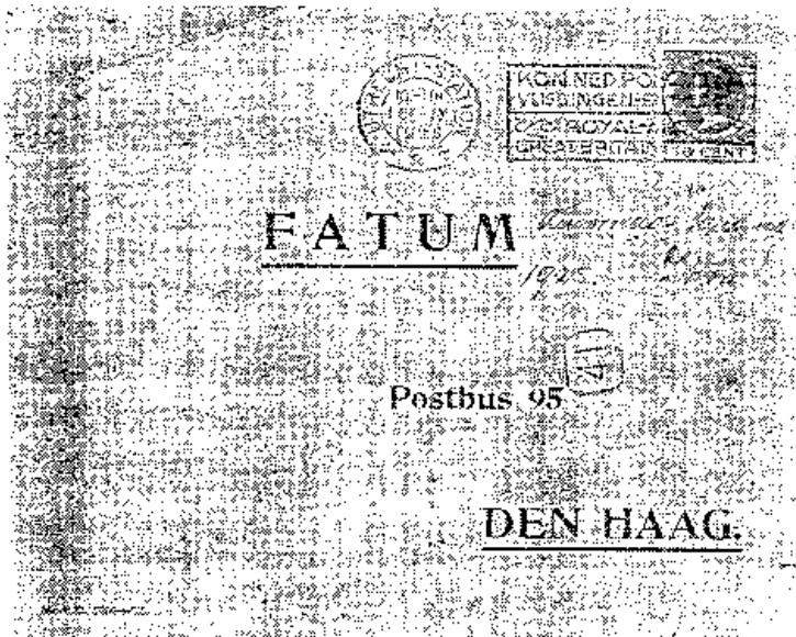
Afbeelding 1: Antwoordbrief dd. 16-9-1925 aan de Ongevallen Verzekering Maatschappij "FATUM". De brief is gestempeld te Utrecht en heeft een duidelijk zichtbare vouw, zoals dit vaak voorkomt bij antwoordbrieven.

Hieronder verstaat men dat het zegel "los" is bijgevoegd bij een brief, met de bedoeling dat het zegel gebruikt wordt als frankering bij de reactie (Uit de jaren zestig zijn hiervan voorbeelden bekend van de firma Reader Digest). Omdat de POKO- en Micheliemachine ook het zegel bevochtigde (voor het plakken), is het gebruik als antwoordzegel niet logisch.