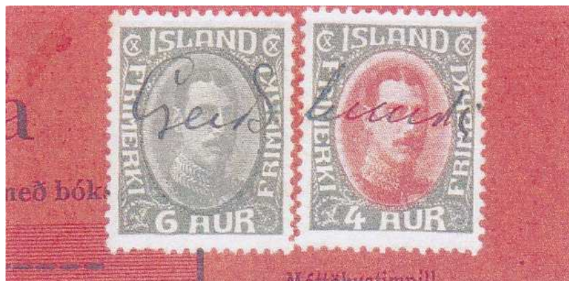
Afb.2 Ontwaarding door pennotitie Greidslumerki

Deze zegels konden op diverse wijzen ontwaard worden. o.a. door middel van pennotities, (zie afb.2) handtekeningen of initialen, maar ook door het plaatsen van een bedrijfs- of datumstempel; zelfs poststempels kunnen we terug vinden. Het kwam ook regelmatig voor dat de zegels niet ontwaard werden.