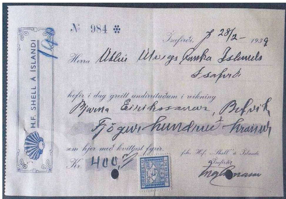
Afb. 3. Kwitantie met Greidslumerki met perfin S.Á.Í.

Deze belastingverplichting en dus ook het gebruik van deze zegels liep tot 31 maart 1941. Enige tijd terug is er een kwitantie opgedoken waarop een GREIÐSLUMERKI van 10 Aur zat. Zie afbeelding 3.