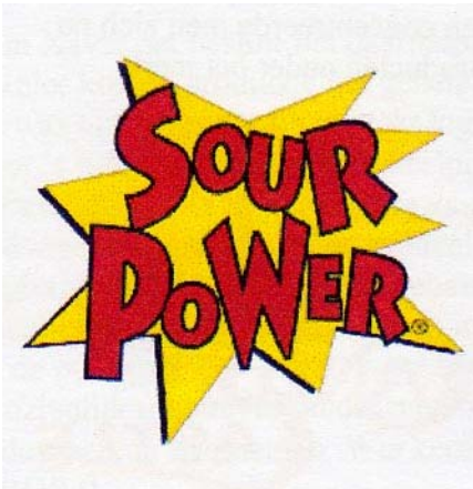
Sour Power® logo