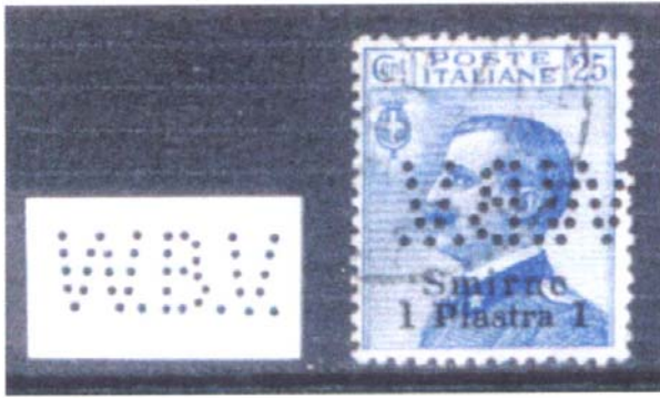
Afbeelding 4: de perfin W.B.V. van de Weense Bank Vereniging.