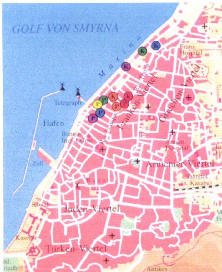
Afbeelding 1: de havenstad Smyrna omstreeks 1910. (bron: 'Marokko und die Türkei' ; Philatek-Verlag)

Afbeelding 1 toont een plattegrond van de stad Smyrna. Het gele cirkeltje met de letter P is de locatie van het Italiaanse postkantoor. Het kantoor lag vlakbij de haven. In hetzelfde gebouw was ook het Russische postkantoor gevestigd.