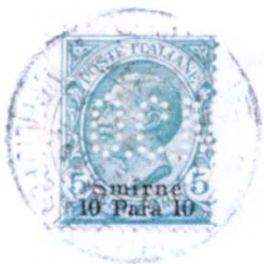
Afbeelding 3: de perfin O.C.M. van Oriental Carpet Manufacturers Ltd.

Het poststempel op de zegel is een dubbelringstempel met in het bovenste segment van het stempel de plaatsnaam 'SMIRNE' en in het onderste segment de vermelding 'UFFICIO POSTALE ITALIANO'. In de datumbalk staat '14 FEB 10'. Afbeelding 3 toont een vergroting van deze zegel.