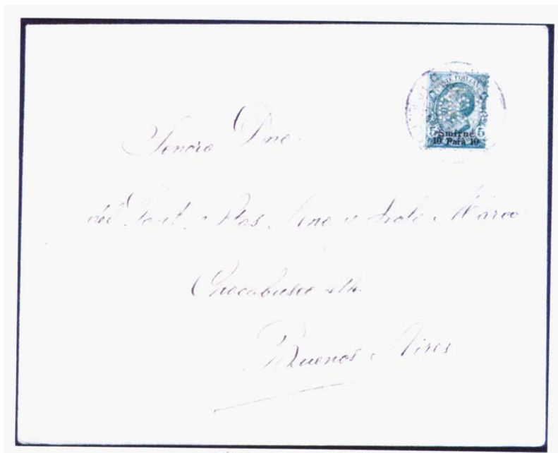
Afbeelding 2: de perfin O. C. M. op een brief uit 1910.

Het poststempel op de zegel is een dubbelringstempel met in het bovenste segment van het stempel de plaatsnaam 'SMIRNE' en in het onderste segment de vermelding 'UFFICIO POSTALE ITALIANO'. In de datumbalk staat '14 FEB 10'. Afbeelding 3 toont een vergroting van deze zegel.