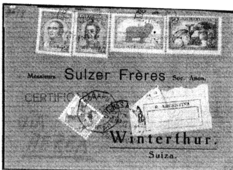
Met toestemming van de auteur overgenomen uit het blad Arbeitsgemeinschaft Schweiz , nr. 49 ( 18e jaargang, 2000)

Naar aanleiding van een oproep over nadere gegevens meldde het postkantoor Winthertur in 1945 zelf: Op verzoek van de firma Sulzer moesten alle aan deze firma gerichte luchtpostbrieven als expressestukken worden behandeld. Dit werd verzorgd door het postkantoor te Winthertur (daarom dragen alle bekende perfins met dit gat het poststempel van het postkantoor.) De toeslag van 40 Rp. per brief werd reeds vooruit voldaan. Om te voorkomen dat deze zegels voor andere doeleinden gebruikt zouden worden werden ze voorzien van een door het postkantoor aangebracht perforatiegat.