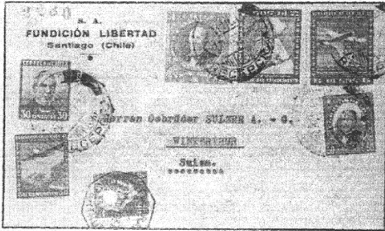
Afb. 2 Luchtpostbrief van Chili naar Winthertur (aankomststempel 30 VIII.37.18 ) gefrankeerd met 40 Rp. als bijfranking voor expresse porto.