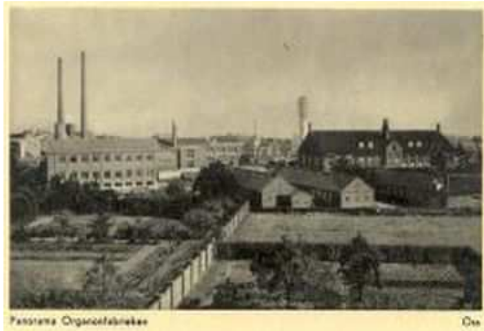
Afbeelding 3: de eerste Organon-fabriek. Het gebouw met de twee schoorsteenpijpen links zijn van de Zwanenberg-fabriek.

Organon (zie afb. 3) hield zich bezig met de bereiding van pharmaceutische orgaanpreparaten (geneesmiddelen). Zwanenberg (zie afb. 4) was vooral een vleeswarenfabriek. Twee heel verschillende bedrijfstakken dus.