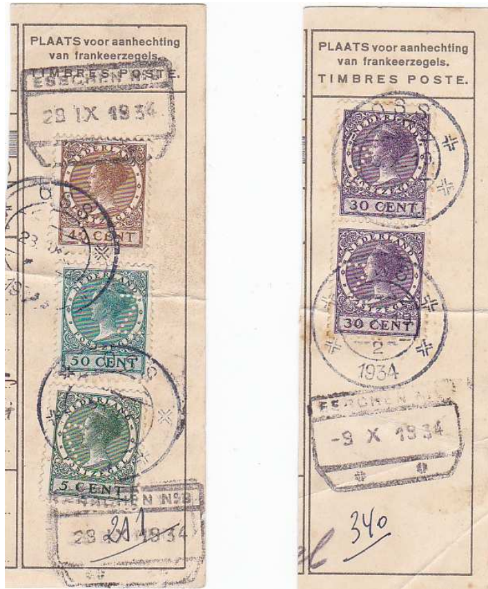
Afbeelding 1: twee kaartstukjes uit 1934 met alleen de Z in de zegels geperforeerd

Wat me al een tijdje verwondert is dat de perfin ZO vaak maar met alleen de Z te voorschijn komt. Dat alleen perforeren van de Z lijkt bewust te zijn gebeurd. Zie bijvoorbeeld de twee kaartstukjes met ZO-perfins (afb. 1). Allemaal alleen met de Z.