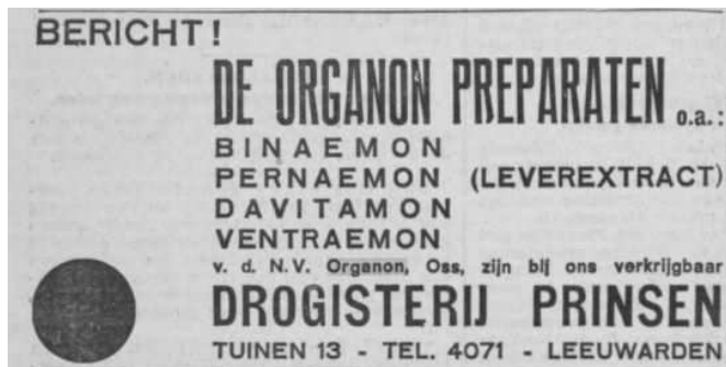
Afbeelding 5: advertentie voor Organon-producten in de Leeuwarder Courant 15 dec. 1936