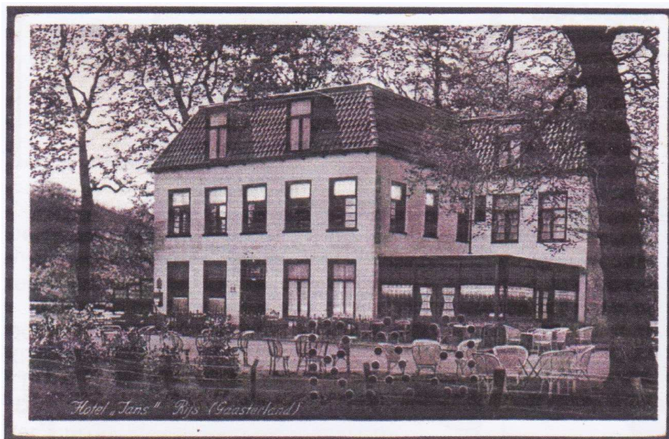
Afb. 3 Perfin RA3 in prentbriefkaart Rijs

In PP 113 heb ik melding gedaan van de perfin RA3 in een prentbriefkaart van Doetinchem. Na deze melding heb ik 2 reacties gekregen met hierbij afbeeldingen van prentbriefkaarten van andere plaatsen. Alle kaarten zijn ongebruikt. Omdat het hier gaat om diverse plaatsen kan geconcludeerd worden dat noch de uitgever, noch de verkoper van deze kaarten de perfin heeft aangebracht.