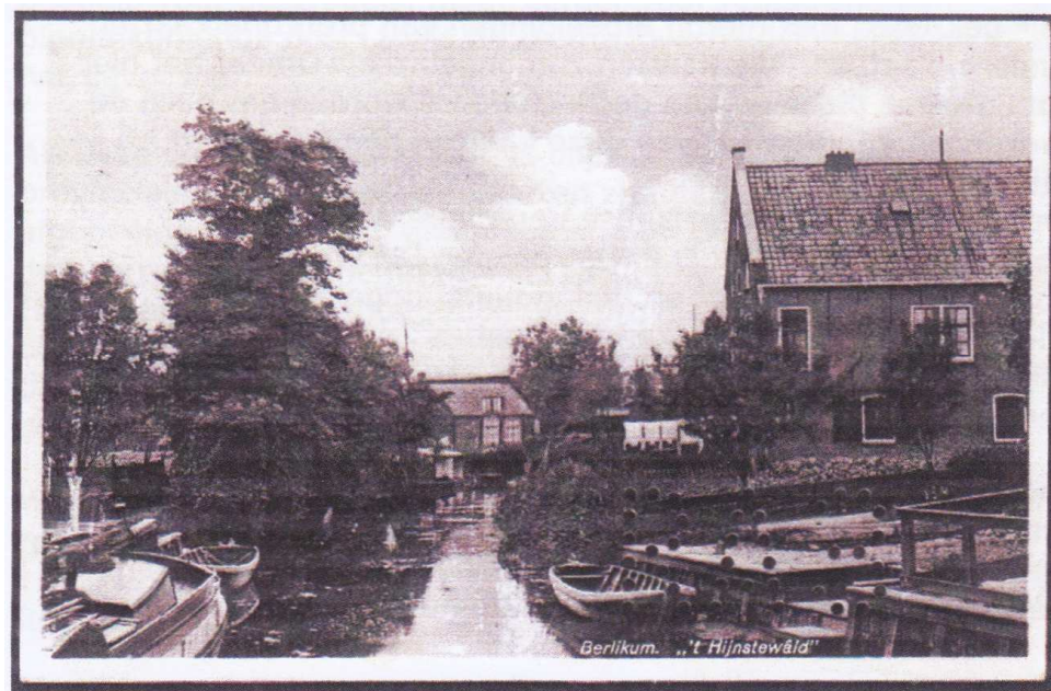
Afb. 2 Perfin RA3 in prentbriefkaart van Berlikum