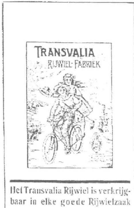
Afb. 1 Advertentie Transvalia

De broers waren in Hoek ook zeer actief als het ging om organisatie en/of sponsoring van rijwielshows en wielerveesten.