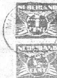
Afb 2 Enveloppe Transvalia Rijwielafabriek