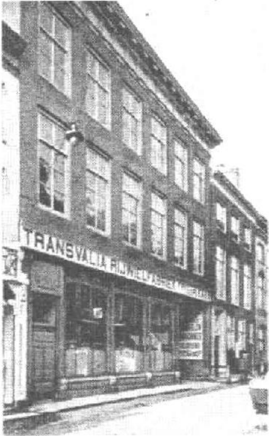
Afb. 3 Transvalia Rijwiefabriek Transvalia voor de brand in 1929