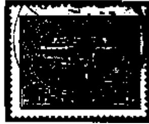
Zegel van Rusland met Pools stempel 'Brest-Litowsk'

10. De perfin WZOR (over twee zegels) is geen firmaperforatie. Deze perforatie werd door de Poolse post aangebracht wanneer zegels voor expositiedoeleinden werden verstrekt. Het Poolse woord 'wzor' betekent 'specimen'.