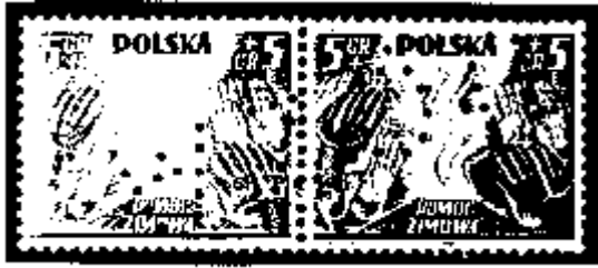
W Z O R