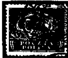
Polen 5 Kronen

9. Voordat in 1920 de eerste zegels voor gebruik in de gehele republiek verschenen, heeft Polen op 27-1-1919 voor Noord- resp. Zuid-Polen twee aparte frankeerseries uitgegeven. De zegels voor Noord-Polen hebben een frankeerwaarde in Marken en die voor Zuid-Polen in Kronen. In verband met inflatie van de Poolse munt werd tijdelijk de munteenheid van de verjaagde 'bezetter' aangehouden. Deze bijzondere zegels waren geldig tot halverwege 1922.