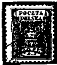
Polen 25 Heller