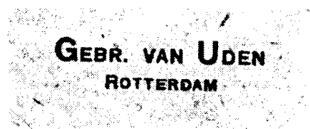
Naam van de gebruiker op achterzijde van de enveloppe.

Bij brief van 6 september 1912 ontving de PTT het verzoek voor levering van rollen, waarbij het "kopeinde" van de zegel zich aan het uiteinde van de rol moest bevinden. Dit verzoek kwam van de Duitse firma Michelius te Frankfurt en in Nederland vertegenwoordigd door de firma J.A. Ruys, handelsvereniging te Rotterdam.