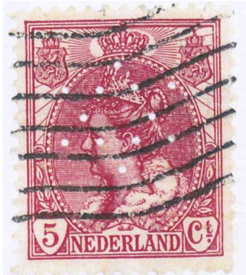
Afbeelding van de Michelius vondst.

(Door P. Loomans; uit: Perfinpost nr. 96, februari 2011)