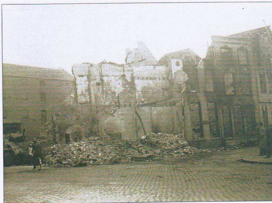
Afb. 5: Het verwoeste bankenpand in oktober 1944. Geheel links is de kapotgeschoten Engelse tank te zien.

Robaver klom uit het dal en nam in 1929 de NBV weer over. Op een foto uit 1942 is op het pand aan de Visstraat alleen nog de naam Rotterdamsche Bank te lezen, maar de perfin NBV bleef dienst doen. In 's-Hertogenbosch duurde dat echter slechts tot 25 oktober 1944. In die dagen vonden zware gevechten plaats tussen Britse en Duitse militairen. De Duitsers schoten op de betreffende dag een Engelse tank in brand. De zakenpanden in de Visstraat tussen Karrenstraat en Kruisstraat werden totaal verwoest. Ook de NBV perforator liet daarbij het leven (afb. 5).