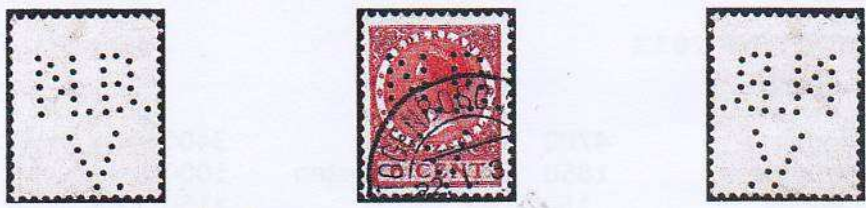
Afb. 1: N.B.V. perfin 's-Hertogenbosch.