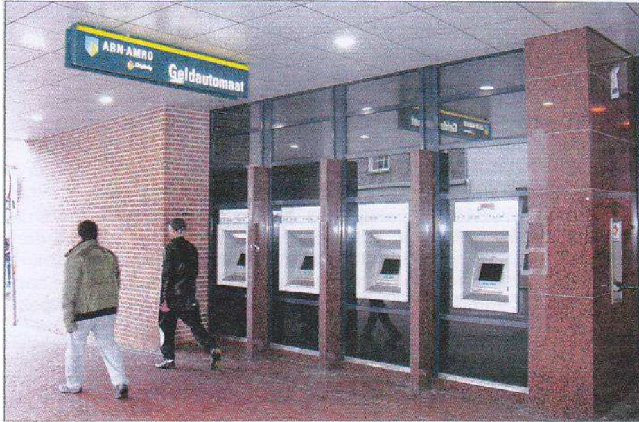
Afb. 6: Geldautomaten aan het voormalige pand van ABN AMRO.

Wat ooit 'NBV' heette, leeft waarschijnlijk alleen nog voort in de verzamelingen van ons, filatelisten.