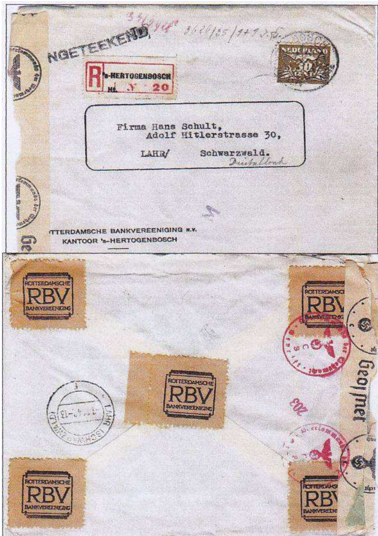
Afb. 2.- Aangetekende brief d. d. 23.10.1942 met perfin N.B.V. Ondanks vijf sluitzegels en het adres in de 'Adolf Hitlerstrasse' is de brief toch voor censuur geopend.