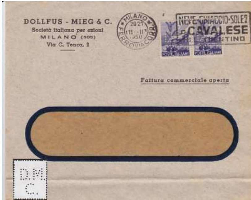
Afb. 1: Brief met perfin DM/C

Dollfus – Mieg & C. Milano Filati (garen en stoffen) Perfin: D.M. /C. (tweevoudige perforator) Gebruikperiode van 1929 t/m 1955. Van 1906 t/m 1911 werd een andere perforator gebruikt zonder puntjes achter de letters.