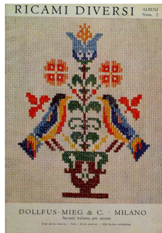
Afb. 3: Album van Dollfus-Mieg & C. met als titel 'Ander borduurwerk'

Tussen de twee wereldoorlogen in wordt de productie verlaagd en in 1961 fuseert het bedrijf met Thiriez & Cartier Bresson. Het gecombineerde bedrijf behoudt de naam DMC. Op dit moment is de DMC groep een internationale organisatie voor garens en stoffen.