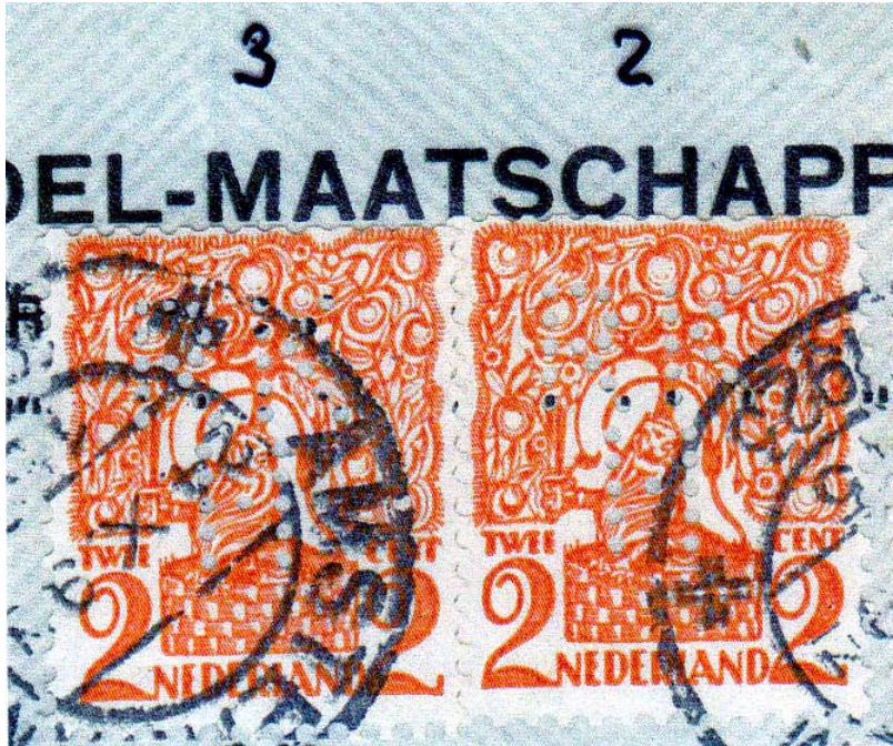
Afb.4 Duidelijk is zichtbaar dat zegel 3 met de tandjes later over zegel 2 is geplakt.

Na iedere zegel kan de brief over deze afstand verschoven worden. Ik heb de zegels op de brief genummerd van 1 t/m 5. Het frankeren gebeurde in die volgorde. Een bewijs hiervoor dat zegel 3 iets over zegel 2 is geplakt (zie afb.4).