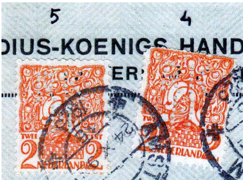
Afb.5 Scheef geplakte zegel 4 door storing van de las in de gebruikte rolzegels.

Zegel 5 heeft een velrandlipje oplageletter "A". De lassen waarmee de rollen uit vellen zegels zijn gemaakt veroorzaakten toch wel vaak storingen. Een ook hier is een kleine storing het scheef plakken van zegel 4 (zie afb.5).