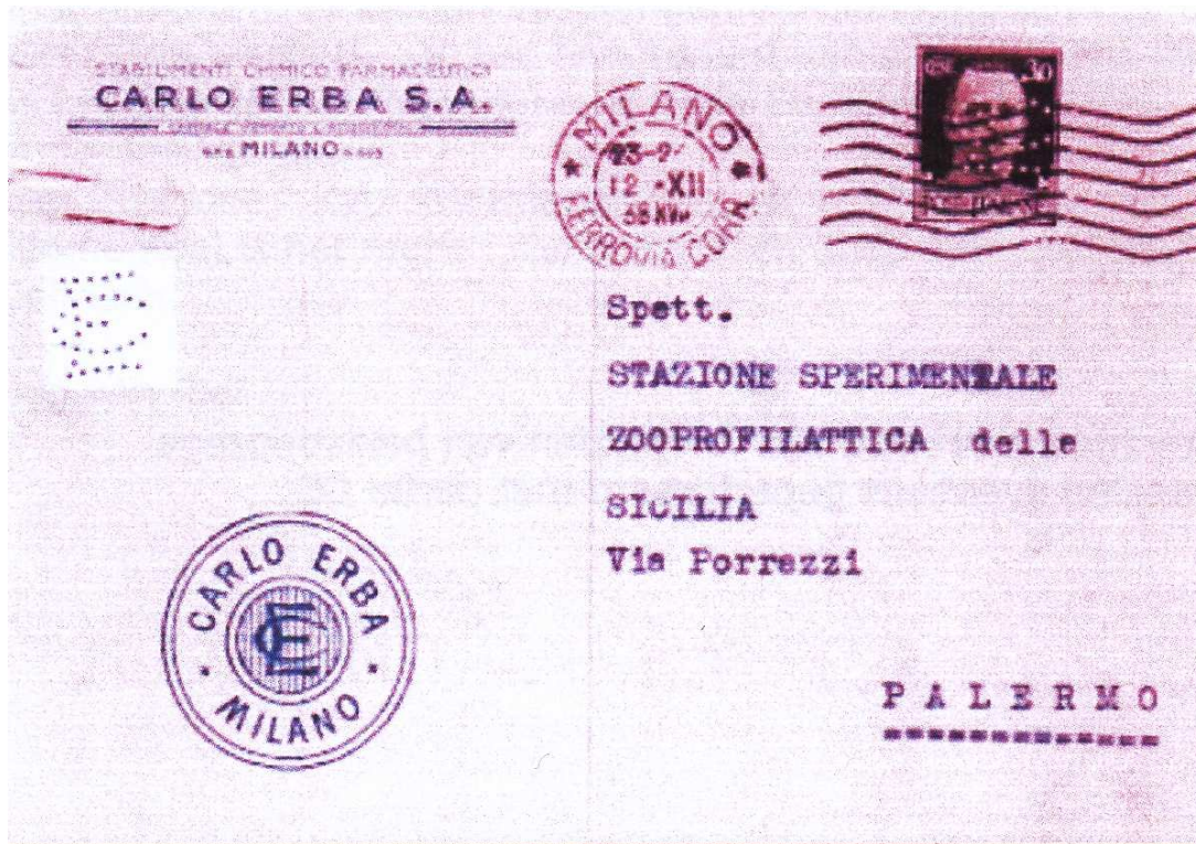
Afb.2. Voorzijde kaart: verzonden op 12-XII-38 met perfin CE

De kaart is verzonden vanuit Milaan op 12-XII-38 naar het landbouwkundig Onderzoek station te Palermo op de achterzijde voorzien van een Marca da Bollo (belastingzegel) van 20 centesimi (nr. 108 Unificato catalogus). (afb.2 en afb.3)