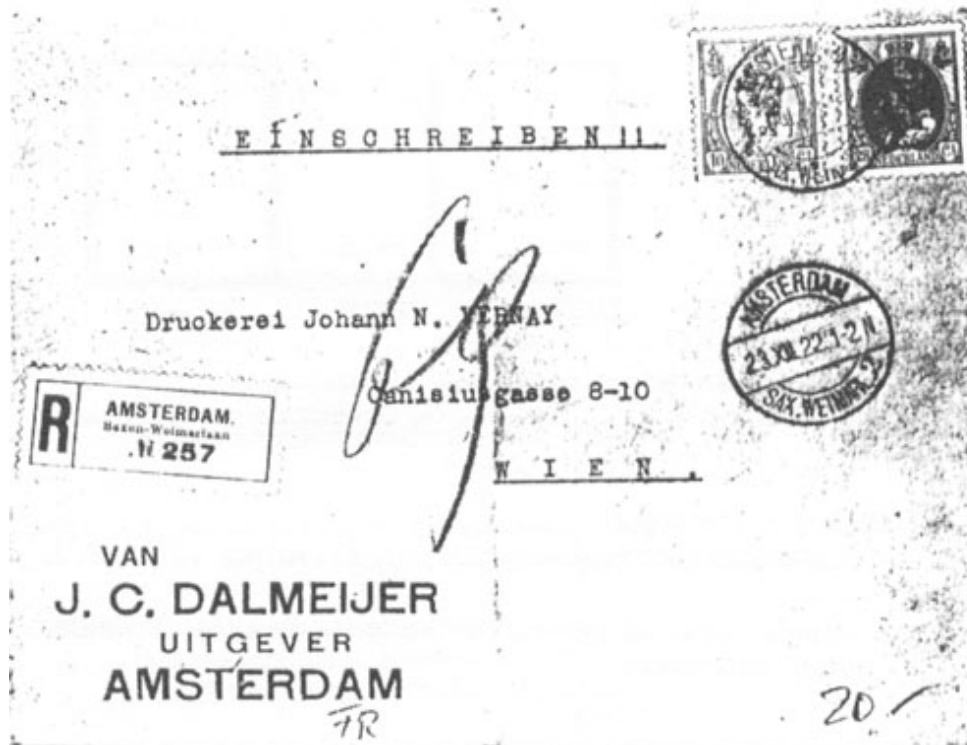
Afb. 1 Aangetekende brief naar het buitenland met het juiste tarief van 35 cent. (Afbeelding bedraagt 75% van de ware grootte)

Na de eerste wereldoorlog en onder invloed van de toenmalige crisistijd ontstond de grote geldontwaarding (inflatie). Dit had o.a. tot gevolg dat bij de PTT per 1 maart 1921 de tarieven werden verhoogd. Interlokale post werd 10 cent en buitenland 20 cent. Daardoor werd om verschillende redenen groot tekort aan Bontkraagzegels van 10 cent veroorzaakt. Want op dat moment waren in de loop der jaren al zo'n 400 miljoen exemplaren van de 10 cent van platen gedrukt en omdat de kwaliteit dermate slecht werd (vooral de medaillon-arcering) is verder productie gestopt. Dit leidde via vernieuwde drukplaten tot de productie van 10 cent zegels in grijze kleur met wijde arcering. Nauwelijks was de productie op gang en de tussentijds nog afgekeurde voorraden van incurante zegels overdrukt met 10 cent in bruin-zwart en rood om uit de impasse te komen, tot alom in den lande stakingen uitbraken. Ook de drukkerij van Enschede werd langdurig getroffen. Een noodmaatregel om het ontstane tekort aan zegels 'iets' te verminderen was de halffabrikaten 5 cent rood en 10 cent grijs ongetand in omloop te brengen. Zo kon het gebeuren, dat postkantoren in grote handelscentra werkelijk zonder postzegels zaten. Hiervan getuigt de afgebeelde enveloppe van uitgeverij Dalmeyer met de correct gefrankeerde aangetekende brief, in de eerste gewichtsklasse, naar het buitenland. Briefporto 20 cent en aantekenrecht 15 cent, een totaal van 35 cent. Zie afbeelding 1