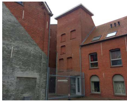
Afb. 10: contouren van de fabrieksgebouwen zijn in grijs op de gevels weergegeven 7)

In totaal zijn er in dit gebied 112 appartementen, 18 grondgebonden woningen, 20 zorgappartementen, 24 groepszorgwoningen en 1.500 m 2 commerciële ruimten gerealiseerd naar een ontwerp van het Belgische bureau awg architecten (zie ook afbeelding 11).