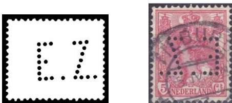
Afb. 5: de perfin EZ 4)

In 1916 begon het bedrijf met het perforeren van postzegels met de initialen E.Z. (zie afbeeldingen). Dat zou het blijven doen tot 1958. Tot 1937 is de perforatie E.Z., daarna vervalt de punt achter de Z. (zie afbeelding 5)