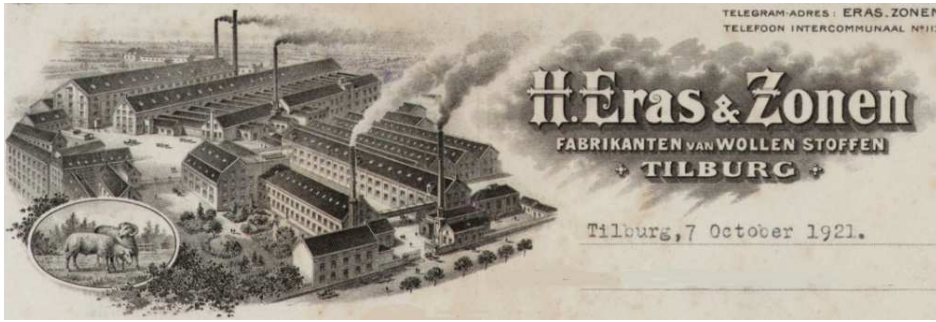
Afb. 6: Briefhoofd van Eras & Zonen in 1921; links het beeldmerk met twee schapen 2)