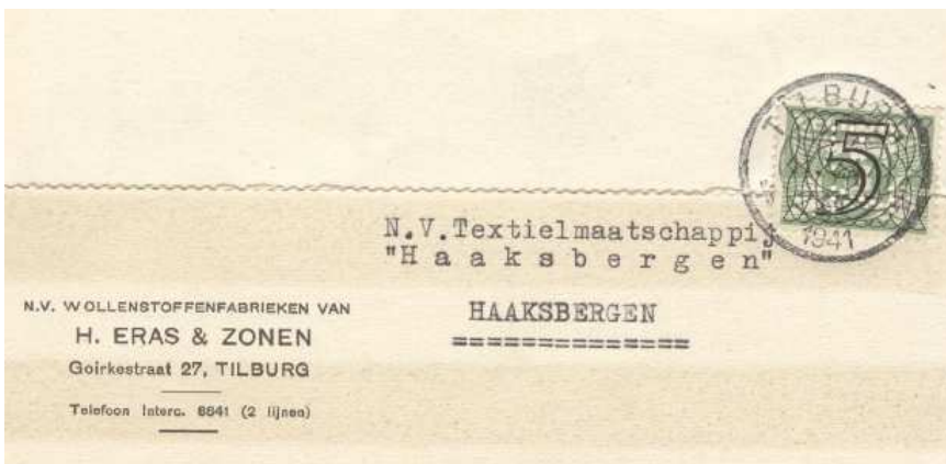
Afb. 8: Deel van een briefkaart uit 1941, toen het bedrijf nog een NV was. 5)