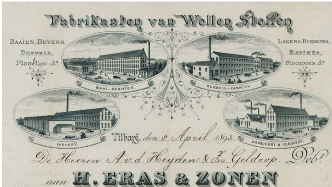
Afb. 1: Briefhoofd van Eras & Zonen uit 1893 met 4 fabrieksgebouwen 2)

Eigenlijk waren het meerdere fabrieken bij elkaar. Zelf maakte het bedrijf onderscheid tussen een baaifabriek*, een bukskinfabriek**, een weverij en een wasserij/ververij (zie afbeelding 1).