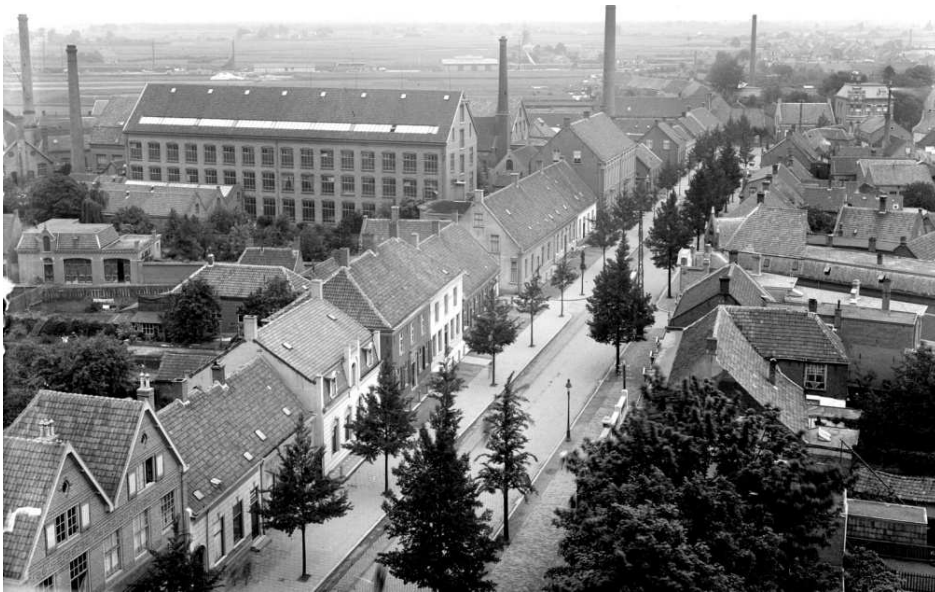
Afb. 7: De Goirkestraat in 1925 met linksboven wollenstoffenfabriek Schoenmakers en daarachter Eras & Zonen. 2)