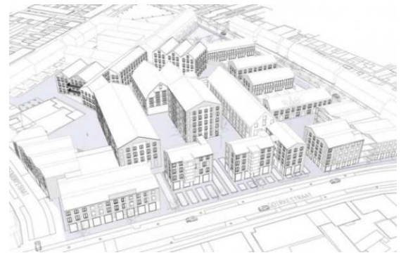
Afb. 11: overzichtstekening van de gebouwen op de Erasplaats 8)

In totaal zijn er in dit gebied 112 appartementen, 18 grondgebonden woningen, 20 zorgappartementen, 24 groepszorgwoningen en 1.500 m 2 commerciële ruimten gerealiseerd naar een ontwerp van het Belgische bureau awg architecten (zie ook afbeelding 11).