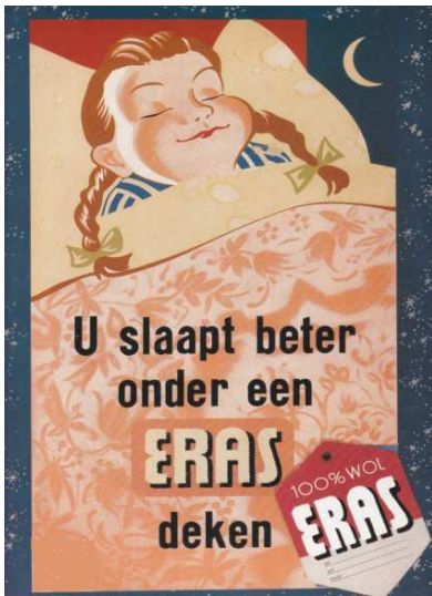
Afbeelding 9: reclame voor Eras-dekens in de jaren zestig van de vorige eeuw. 6)

Door de onverwachte teruggang van de vraag, mede door buitenlandse concurrentie en van modernere bedrijven AaBe en Zaalberg, werd besloten om de productie in 1957 te stoppen.