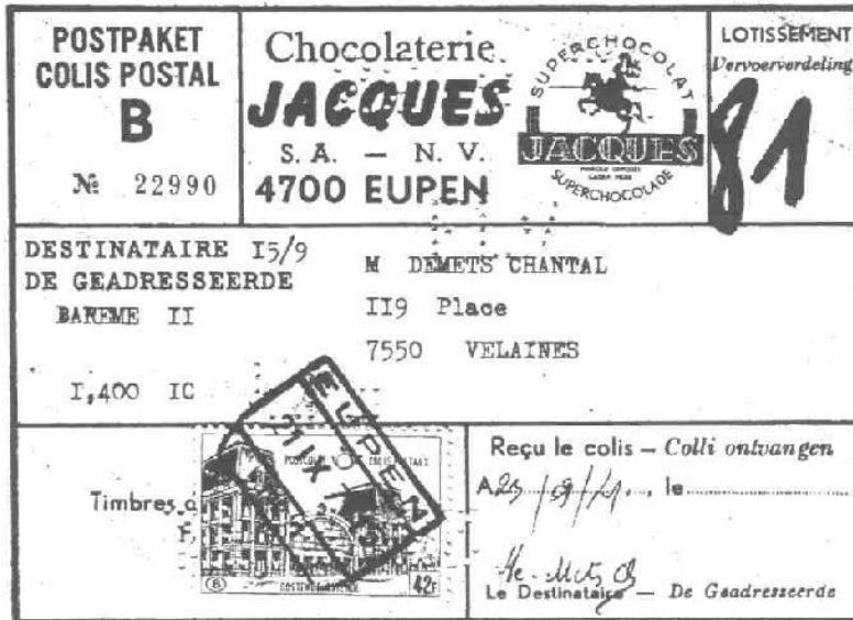
Figuur 1. De voorzijde van een Belgische pakketkaart uit Eupen

Dit was een kleine kaart, die - voor zover mij bekend- afwijkt van de gebruikelijke vrachtbrieven. Er was een reclame op de kaart gedrukt van "Chocolaterie JACQUES SA-NV, 4700 Eupen" Zie figuur 1.