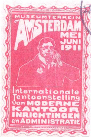
afb. 1 Sluitzegel met aandacht voor de I.T.K.A.

Van 2 mei tot en met 19 juni 1911 werd op het Museumterrein in Amsterdam de Internationale Tentoonstelling van moderne Kantoorinrichtingen en Administratie I.T.K.A. gehouden (zie afb. 1).