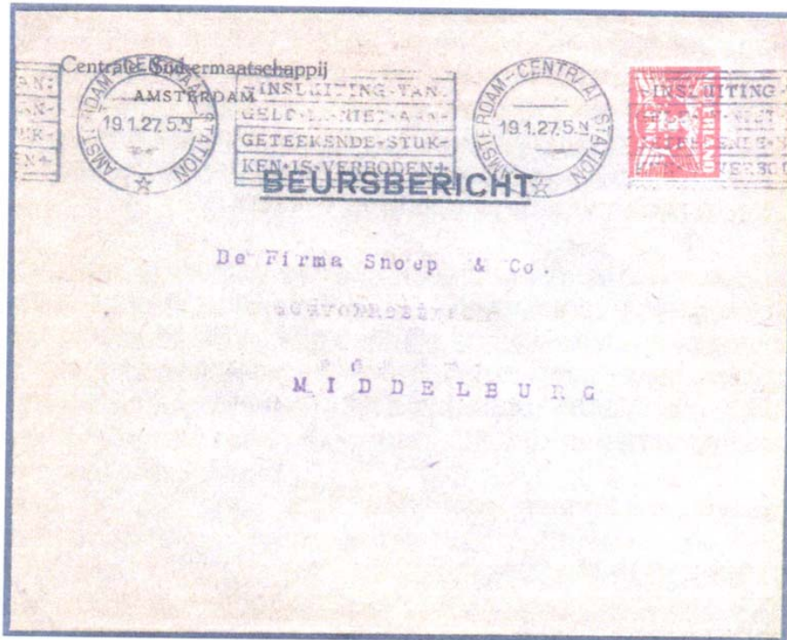
afb. 3 Envelop gefrankeerd met een 2 cent cat. nr. 173A uit 1927.

In de loop van de jaren heb ik er een paar gevonden, waaronder drie op poststuk (zie afb. 3, 4 en 5). De leesbare data zijn 1927 en 1930. Door navraag bij medeverzamelaars kwam ik er nog enkele op het spoor.