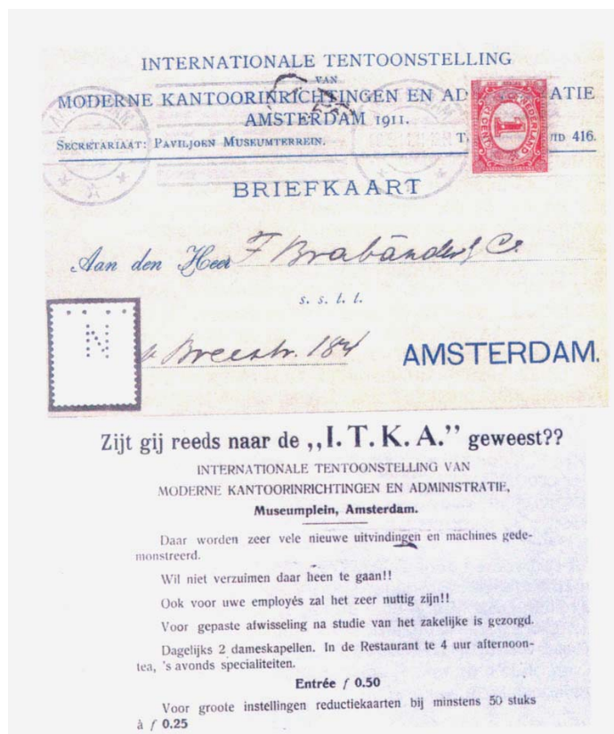
afb. 2 Uitnodigingskaart voor de I. T. K. A. op 20 maart 1911 verzonden en gefrankeerd met een poko.

"Daar worden zeer vele nieuwe uitvindingen en machines gedemonstreerd" stond er op de uitnodigingskaart. Ongetwijfeld was daar ook een plaats ingeruimd voor de Pokomachine, als een van de "zeer vele nieuwe uitvindingen en machines" die daar gedemonstreerd werden. De uitnodigingskaart was gefrankeerd met een zegel van 1 cent met de Pokoperforatie N met 4 punten daarboven (zie afb. 2) en is afgestempeld te Amsterdam op 20 maart 1911. Deze datum geldt daarmee als eerste datum van gebruik van een Pokomachine in Nederland. 1)