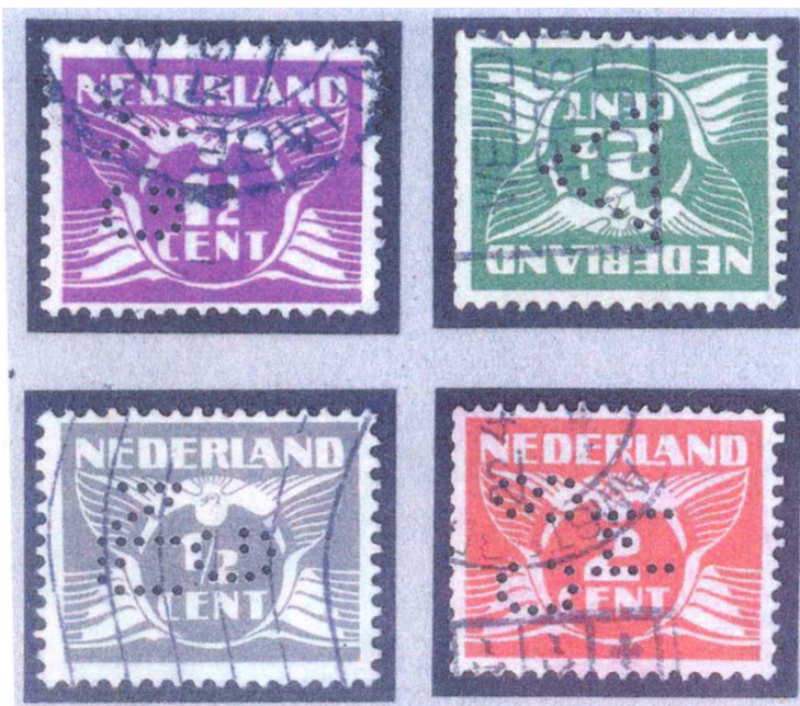
afb. 5 Vier Poko's met tanding K12½ met watermerk.