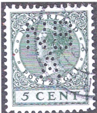
afb. 6 Een nagetande hoekroltanding.

In mei 1999 werd me een Poko NBA cat. nr. 177A ter beoordeling voorgelegd (zie afb. 6). Het papier van dit zegel had inderdaad een watermerk en de Poko was echt met een slijtagepatroon van ongeveer 1934. Bij nadere beschouwing was dit een hoekroltanding waarvan de hoeken waren nagetand. 7) Dus een vervalsing ten nadele van de verzamelaars.