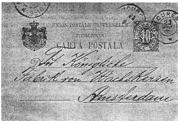
Fig. 6. Perfin Z&Co ( Z3 ) in briefkaart van 10 bani, gedateerd 23-4-1902; gebruiker Zweifel & Co., blijkt uit stempel op achterzijde.