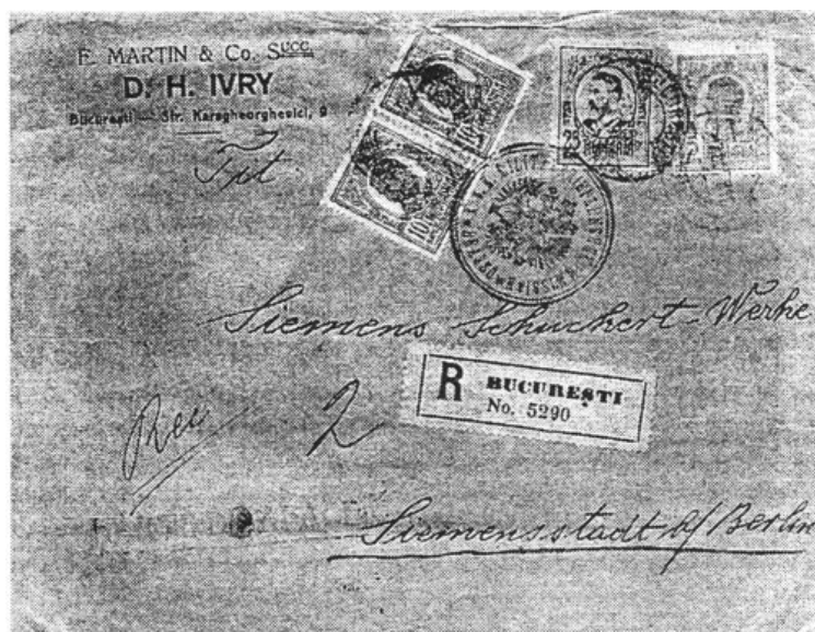
Fig. 2. Perfin DHI (D11) in Mi 215, 222, en 223 op enveloppe gedateerd 1-10-1916 met Hongaarse censuur.