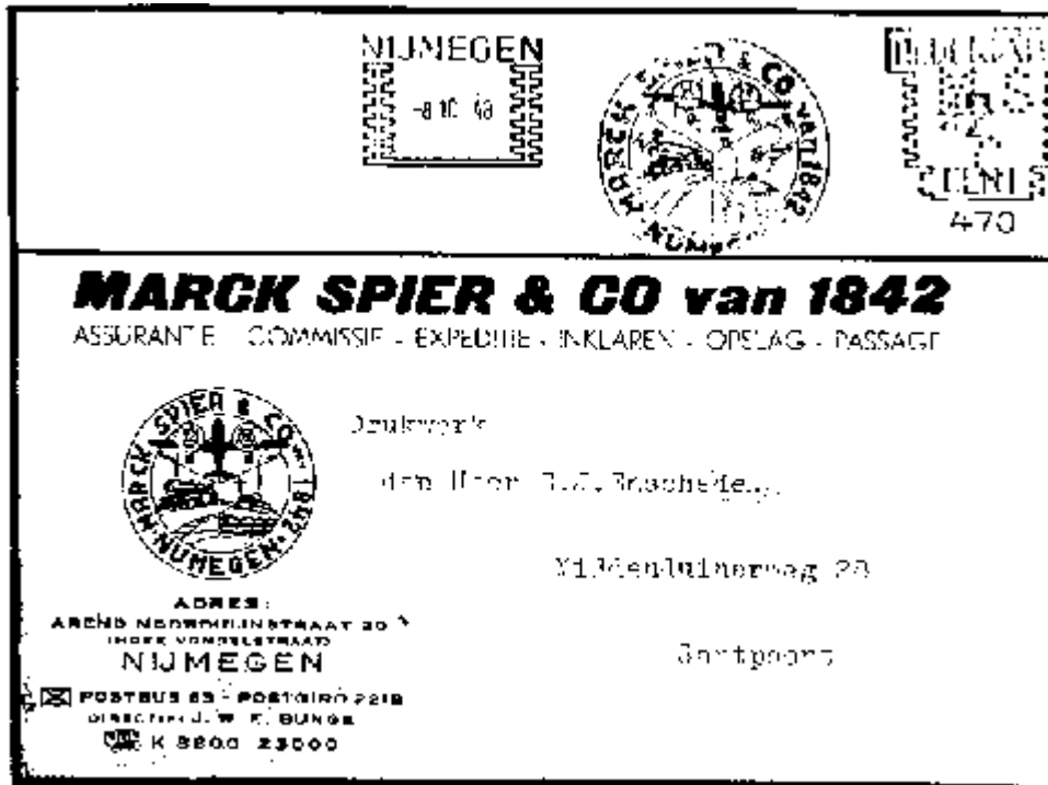
Afbeelding 3. Perfin M.S/C door de briefkaart.

Zowel in het logo op de kaart als in de mini-advertentie van de roodfrankering maakt Marck Spier & Co. op een aantrekkelijke manier duidelijk dat zijn bedrijf actief is bij transporten te land, ter zee en in de lucht.