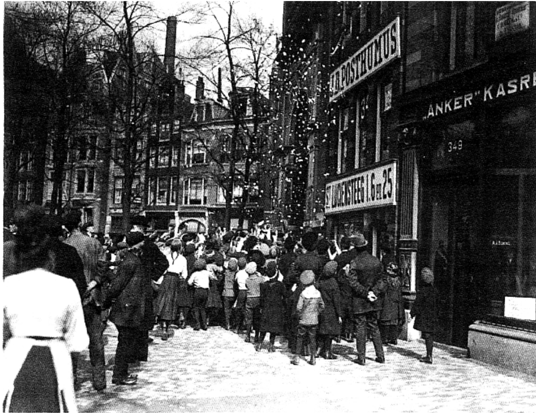
Een grote groep kinderen heeft zich verzameld bij het pand van J.D. Posthumus om sluitzegels die uit het raam worden gegooid, op te vangen. Amsterdam, 1914.

In hetzelfde jaar wordt besloten de fabricage van Stempetiketten (sluitzegels) ter hand te nemen en werd de "Eerste Nederlandsche Stempetikettenfabriek met Electriche Beweegkracht J.D. Posthumus" opgericht. Deze werd gevestigd in het Middenklooster (bij de Munt tussen Singel en Kalverstraat). Deze onderneming heeft als zodanig tot het einde van de eerste wereldoorlog bestaan, toen pand en inventaris in de as werden gelegd en niet weer opgebouwd.