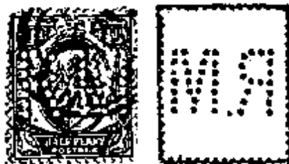
R2 of R3