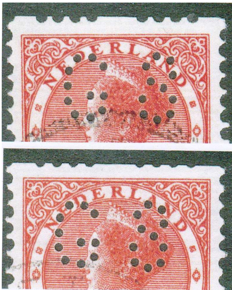
GS1 (boven) GS 2 (onder)

Samenvattend is het onderscheiden van GS 1 en GS 2 als volgt vast te stellen: