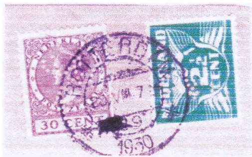
Afb. 2 Beide perfins op één envelop.

Van de firma Schenker & Co. uit Rotterdam heb ik in mijn verzameling een brief waarop beide varianten van deze perfin naast elkaar geplakt zijn (zie afb. 2).