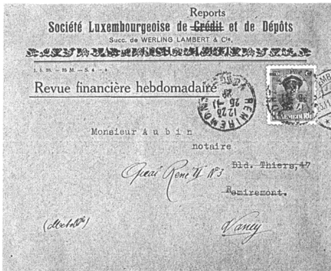
Afb. 2. Brief zonder perfin gedateerd 23-11-28

Gezien de aard van de perforatie, het feit dat in "kleine" en "grote" zegels keurig één keer de perfin voorkomt, is het aannemelijk dat het hier gaat om een enkelvoudige perforator.