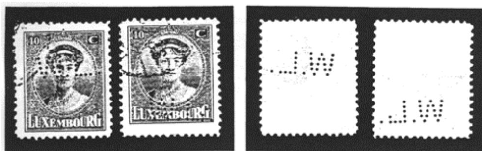
Afb. 3. De perfin W.L.

Met de ondergang van de bank is het echter ook misgegaan met de perforatie. In de periode 1912 tot en met 1927 verschijnen zegels met een complete perfin, zegels waarbij de L een gaatje mist, en zegels waarbij de afdruk van dit laatste gaatje nog net zichtbaar is. De eerste zegel waarin dit zichtbaar is komt uit de emissie van 1906, Groothertog Wilhelm IV en de laatste uit de emissie van 1921, Charlotte en face. (zie afb. 3)