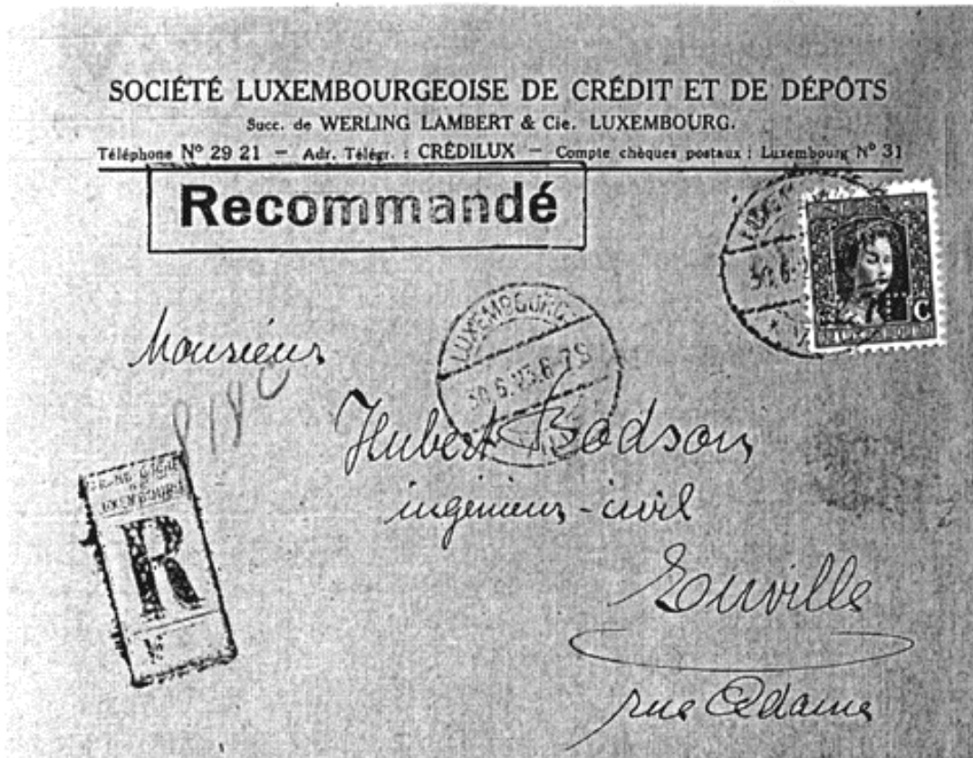
Afb. 1 Brief met perfin W.L. gedateerd 30-06-23

Uit onderstaande brief, gedateerd 30-06-23 Luxemburg-ville, blijkt dat na de overname de perforatie W.L. gewoon in gebruik is gebleven. (zie afb. 1)