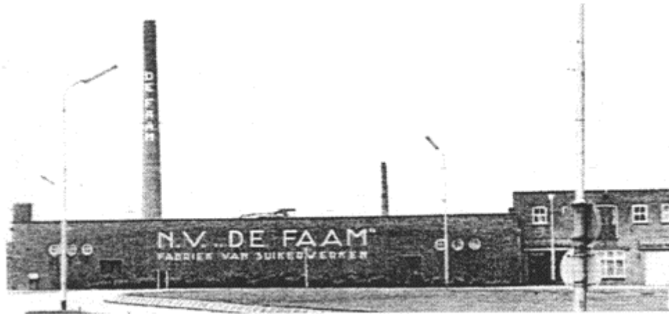
De Faam-fabriek aan de Liniestraat