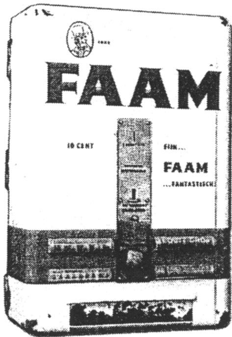
Eén van de muurautomaten van De Faam.