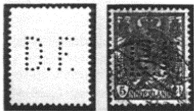
Afb. perfin D. F.

Gedurende een zeer korte periode, namelijk van 1919 tot 1920 werden door D e Faam, Liniestraat, de postzegels NVPH 55, 57, 60, 61, en 62 met een perfinapparaat voorzien van de firma-initialen D.F. Gezien de korte gebruiksduur een zeer gezochte perfin. De "Mauritius" onder de perfins.