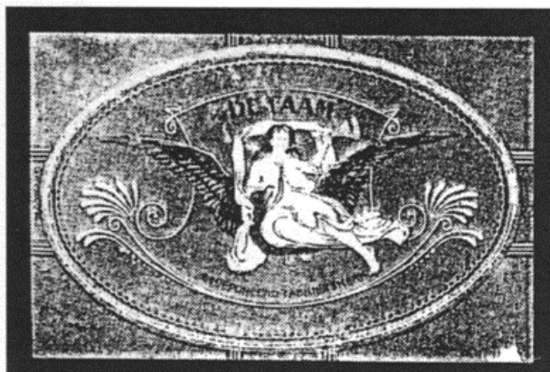
Fama, de godin van het gerucht.

Als beeldmerk gebruikte N.V. De Faam aanvankelijk een afbeelding van de Romeinse godin van het gerucht, Fama.