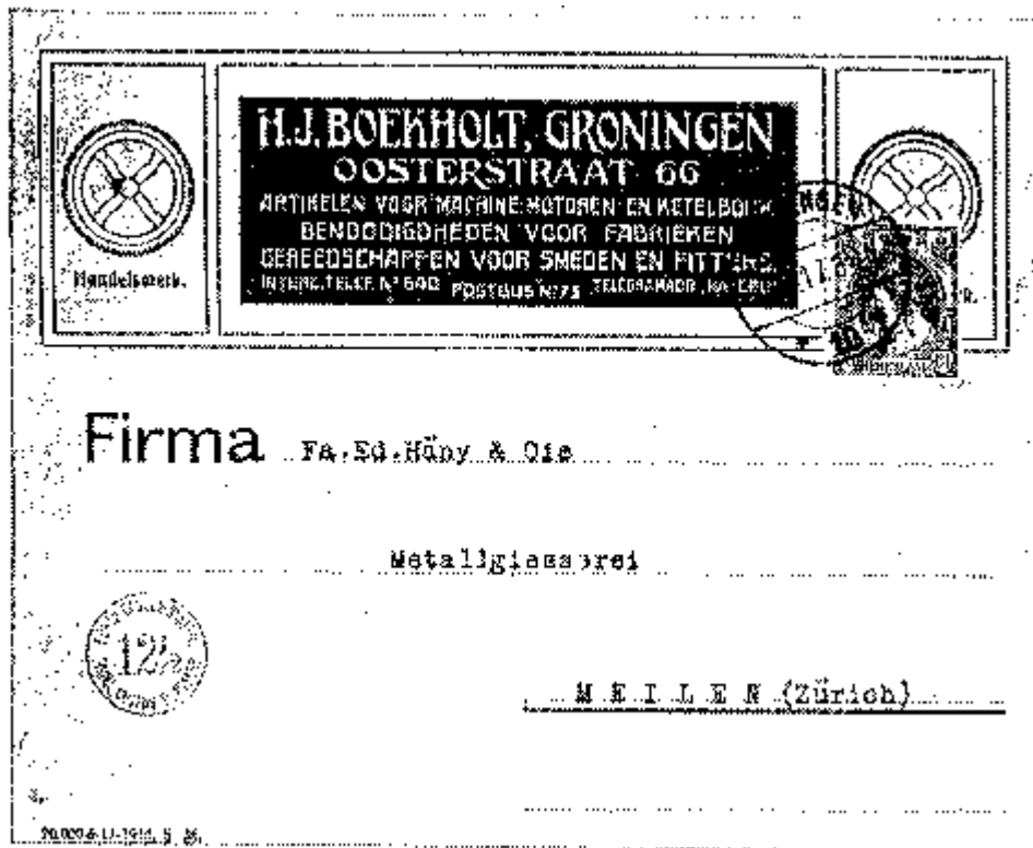
Afb. 3. Enveloppe met links Custos-stempel.

Schrijver dezes zijn geen publicaties bekend omtrent aantallen geïmporteerde apparaten in ons land, noch van firma's waar "Custos" in gebruik was. Dat het apparaat hier werd gebruikt blijkt uit afb. 3.