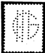
Gebruiker onbekend, Rotterdam