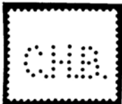
Continentale Handels Bank, Amsterdam