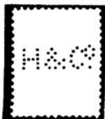
Henri Huinck & Comp. Rotterdam