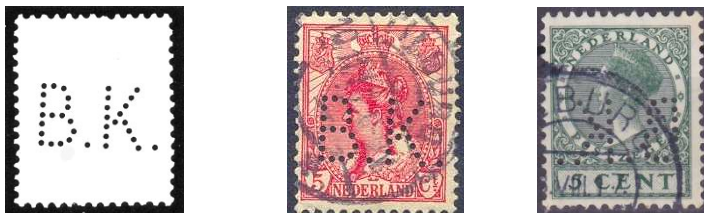
Afbeelding 2: de perfin BK 1

Vanaf 1909 tot 1934 gebruikte de firma de perfin BK1 (zie afbeelding 2)