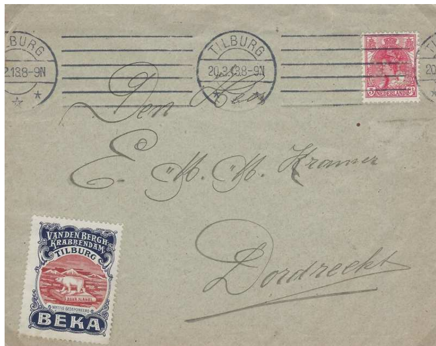
Afbeelding 4: perfinbrief van de BEKA gedateerd 20 maart 1913**.

Dit beeldmerk is ook te zien op een plakzegel op een brief met de perfin BK 1 uit 1913. (zie afbeelding 4)