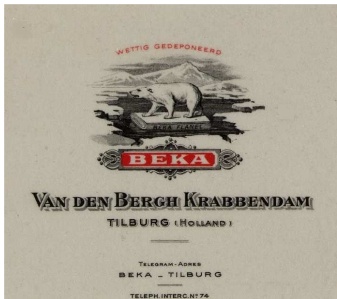
Afbeelding 3: het beeldmerk van BEKA (1914)*.

Dit beeldmerk is ook te zien op een plakzegel op een brief met de perfin BK 1 uit 1913. (zie afbeelding 4)