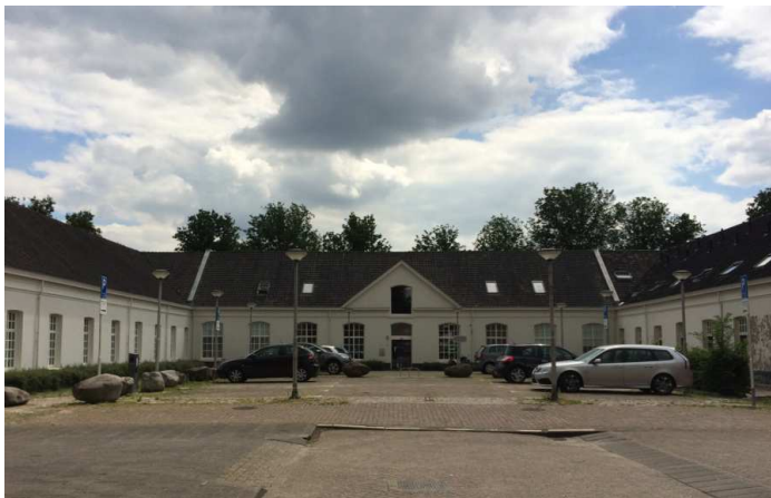
Afbeelding 8: carrévormig stallencomplex met daarin het Regionaal Archief Tilburg

In de jaren zestig van de vorige eeuw kwam ook hier de buitenlandse concurrentie in de textiel hard aan. In 1968 moest de BEKA haar poorten sluiten. Er werkten toen nog 278 mensen. De bedrijfspanden die bij de kazerne waren bijgebouwd werden gesloopt. Het nog resterende deel van de voorbouw en het carrévormige stallencomplex kwamen op de monumentenlijst en werden in 1987 gerestaureerd. Vanaf 1988 zijn een aantal kantoren en het Regionaal Archief Tilburg erin gevestigd (zie afb. 8). In de rechterzijvleugel is men nu een aantal woningen aan het realiseren.