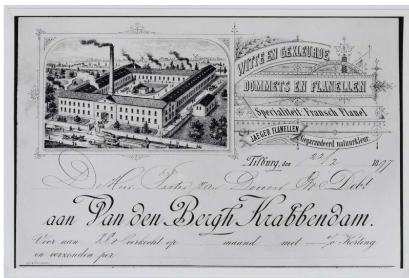
Afbeelding 5: Briefhoofd van BeKa uit 1897, waarop de tot fabriek omgebouwde kazerne te zien is*.

Vanaf die tijd was Tilburg een garnizoensplaats en bleef dat tot 1856 toen de laatste twee eskadrons lanciers uit de stad vertrokken. Het complex werd verkocht aan de Gemeente Tilburg, die het op haar beurt in 1859 verkocht aan de leerlooierij De Kanter en wollenstoffenfabriek BeKa (zie ook afb. 5 en 6).