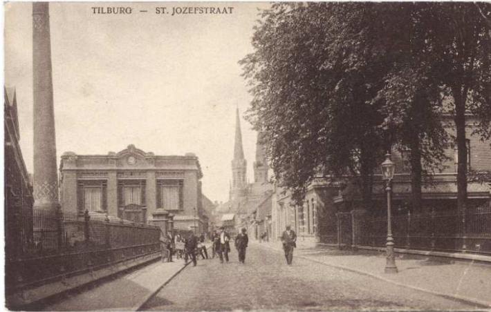
Afbeelding 7: Op deze prentenbriefkaart uit 1915 is links de BEKA-schoorsteen met erachter het ketelhuis te zien*.