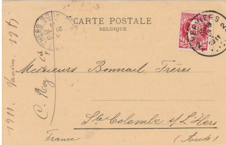
Afb.1: de perfin C 106

In de huidige catalogus van Belgische Perfins staat de perfin CN/C niet vermeld; in de catalogus van Hammink en van der Hoorn stond deze vermeld onder nr. C 106 met als gebruiker C. Noz, Verviers. Zie afb. 1