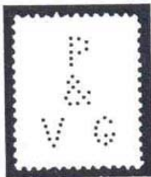
Afb. 2. De gebruikte perfin door Prinzen en van Glabbeek.

Dit verklaart ook de relatief korte duur, dat deze firma zegels perforeerde met de initialen P & V G, zie afb. 2. Volgens de Ned cat. is dit perforaat gebruikt van 1892 tot 1902.